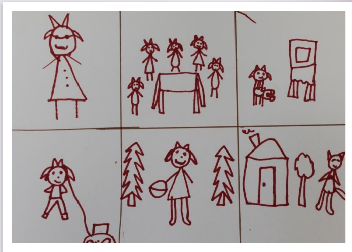
Сказка «Волк и семеро козлят».