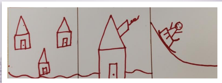
Стихотворение «Вот моя деревня»