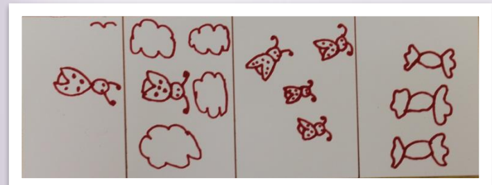
Закличка «Божья Коровка»