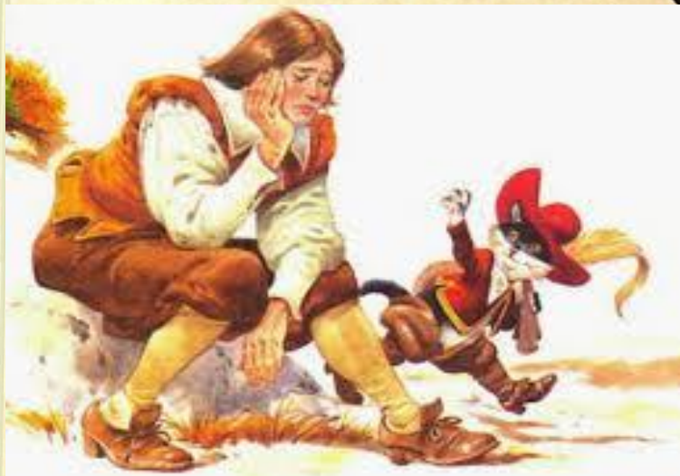
Ш.Перро « Ко т в сапогах»