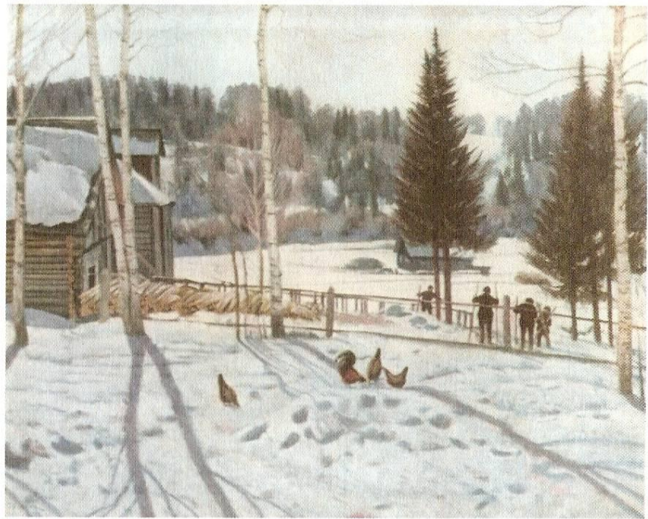
К. Юон «Конец зимы. Полдень»

Ульченко З. Ф. Диктанты с изменением текста. М.: Просвещение, 1982.