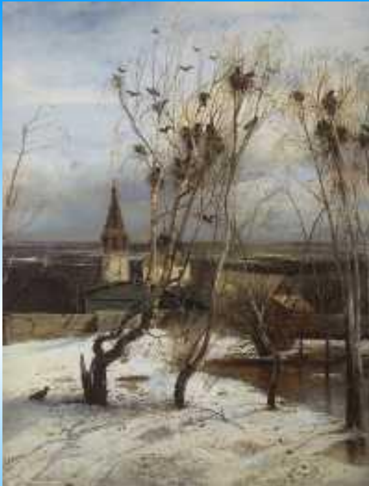
Саврасов. Грачи прилетели 1871 Государственная Третьяковская Галерея, Москва, Россия

В детстве Саврасов зарабатывал тем, что писал небольшие пейзажи на продажу. Долго художник ждал подходящего момента, взрыва, который даст жизнь его дремлющему вдохновению. Грачи прилетели – момент настал, родился шедевр, ставший своеобразным символом России.