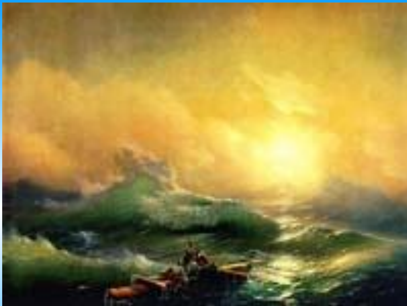
Айвазовский. Девятый вал 1850

Юный Айвазовский любил играть на скрипке, петь и рисовать самоварным углем на стенах домов, а еще он испытывал просто необыкновенную страсть к морю с рождения и до конца своих дней.