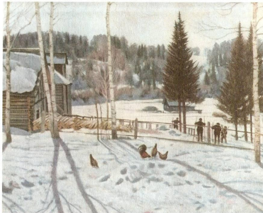
К. Юон «Конец зимы. Полдень»

Ульченко З. Ф. Диктанты с изменением текста. М.: Просвещение, 1982.