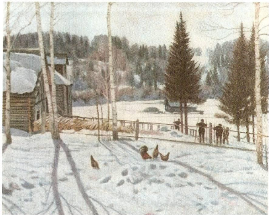
К. Юон «Конец зимы. Полдень»

Ульченко З. Ф. Диктанты с изменением текста. М.: Просвещение, 1982.