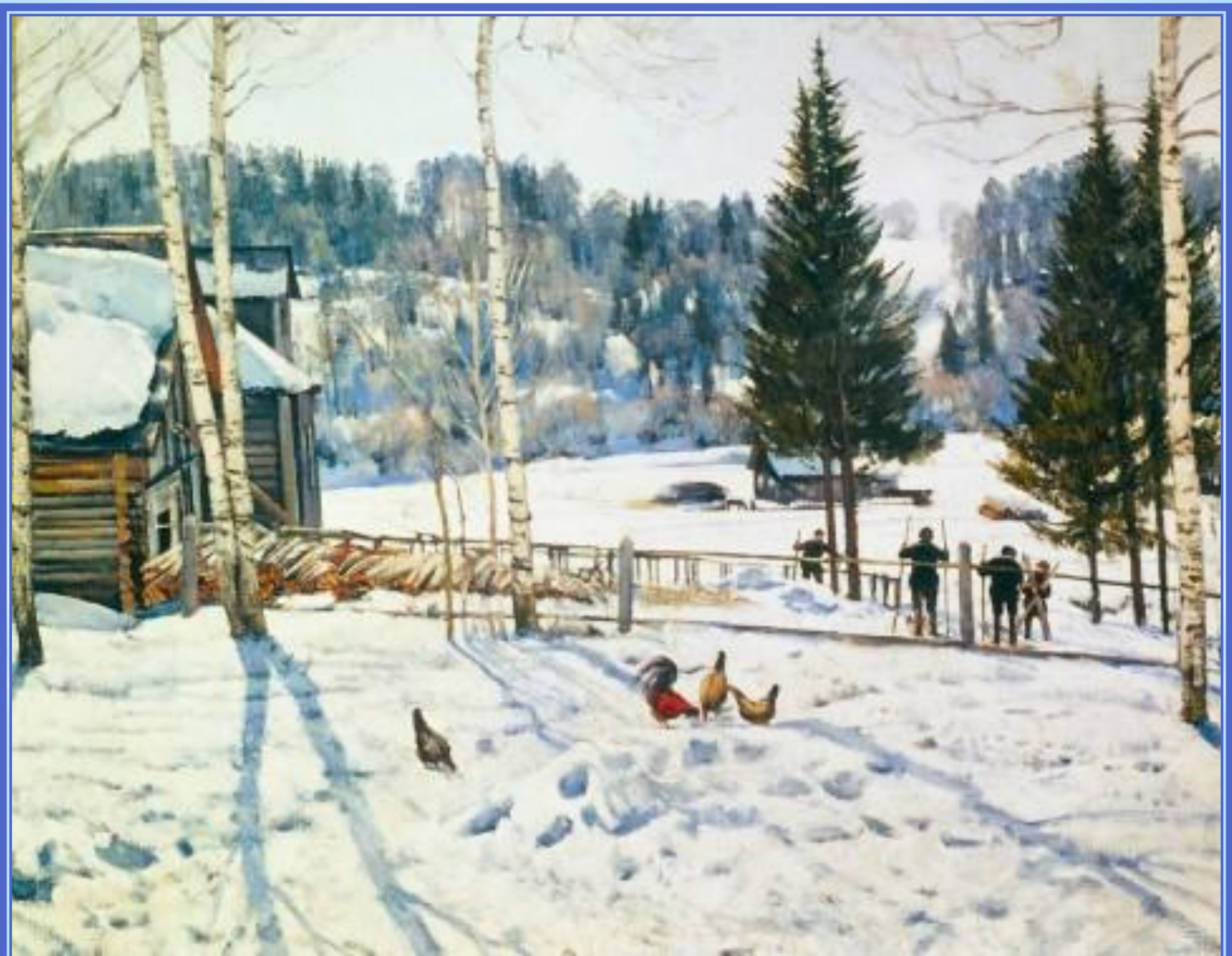
К. Ф. Юон «Конец зимы. Полдень» 1929 г.