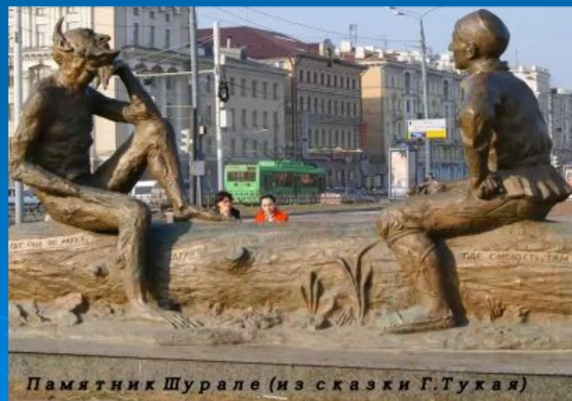
Памятник Шурале (из сказки Г.Тухая)