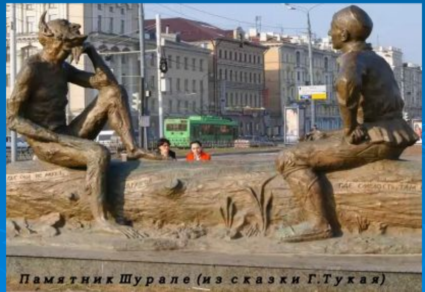
Памятник Шурале (из сказки Г.Тухая)