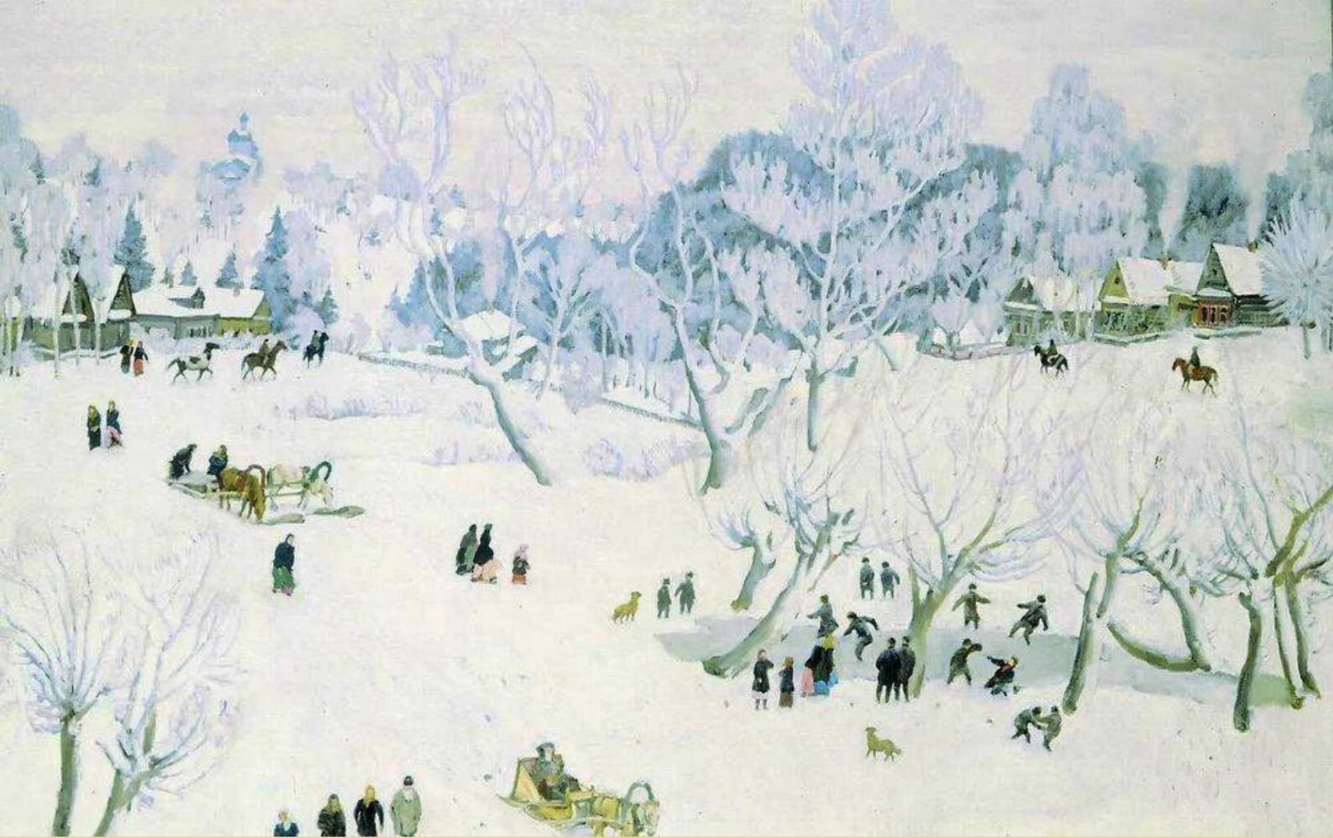
Волшебница – зима. Лигачёво. 1912 г.