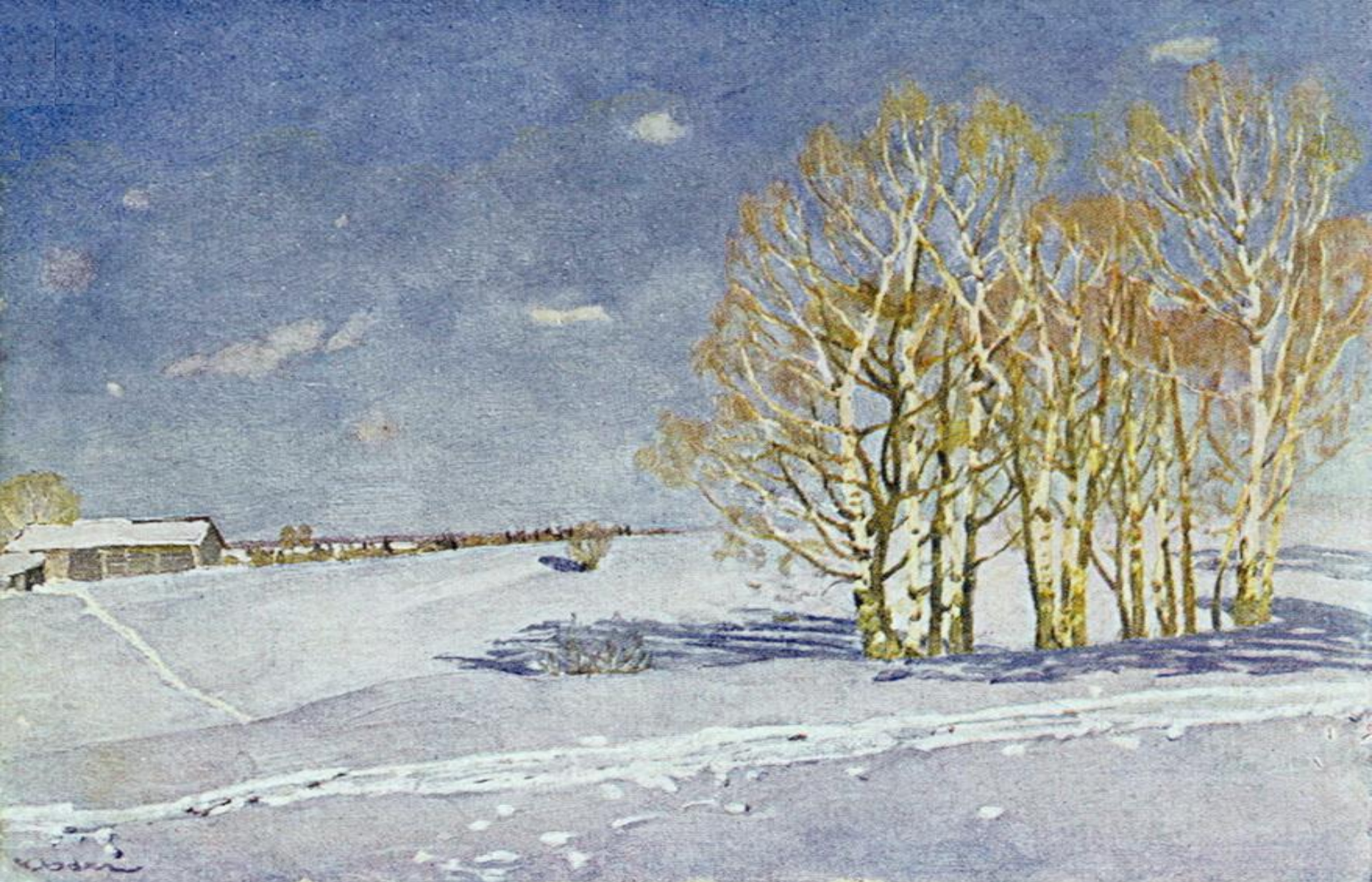
Зимний синий день. 1915 г.