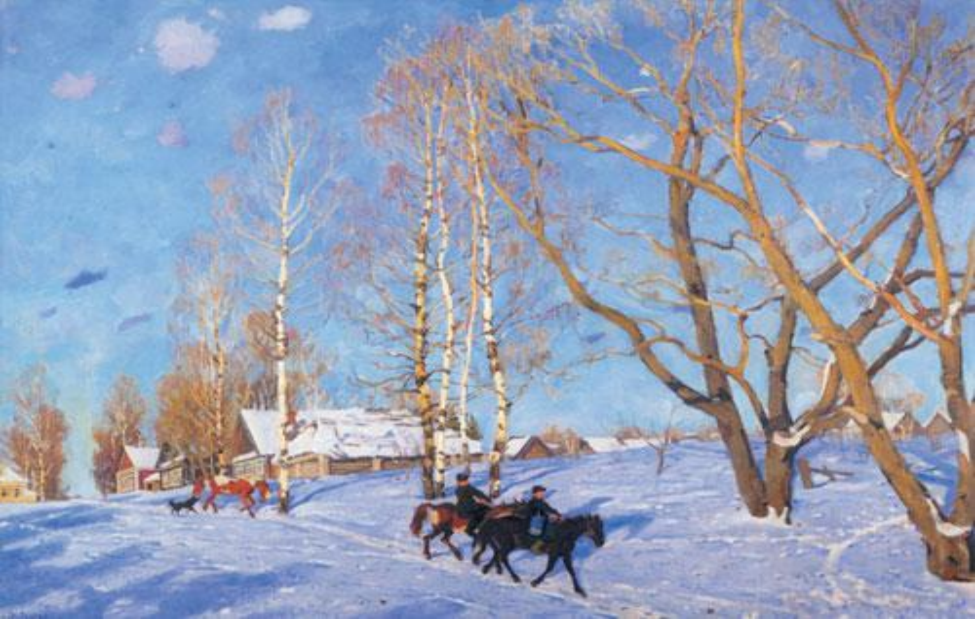
Мартовское солнце. 1915 г.