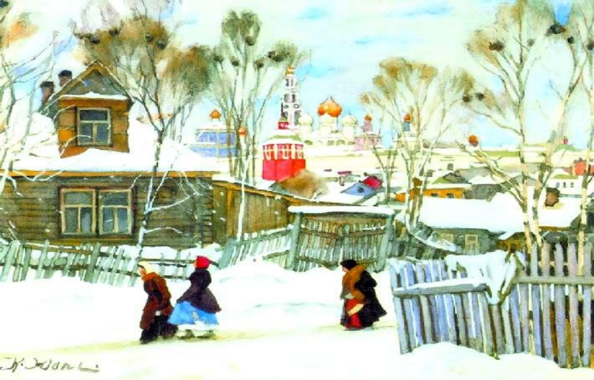
Весна в Троицкой Лавре. 1911 г.