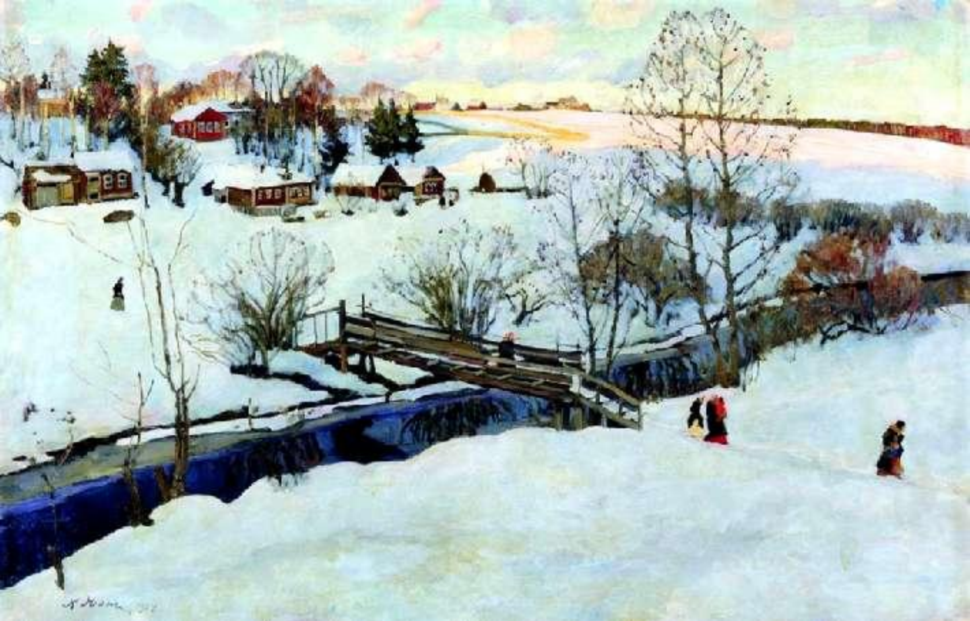
Зима. Мостик. 1914 г.