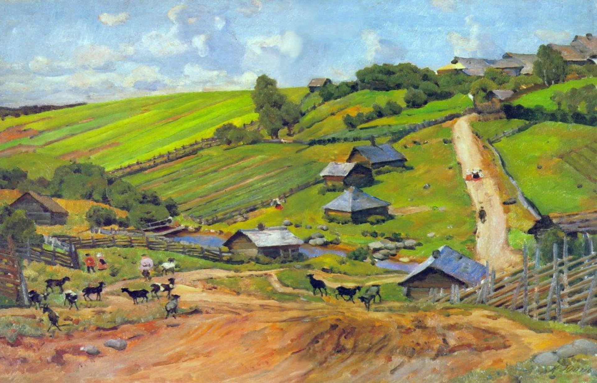
Деревня Новгородской губернии. 1912 г.