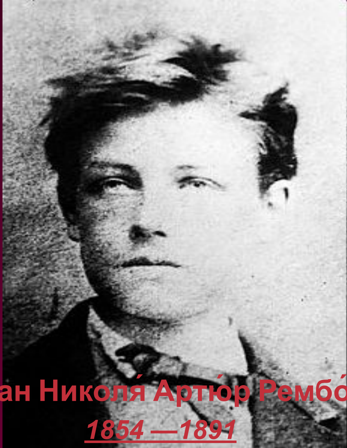
Жан Николя Артюр Рембо 1854 — 1891