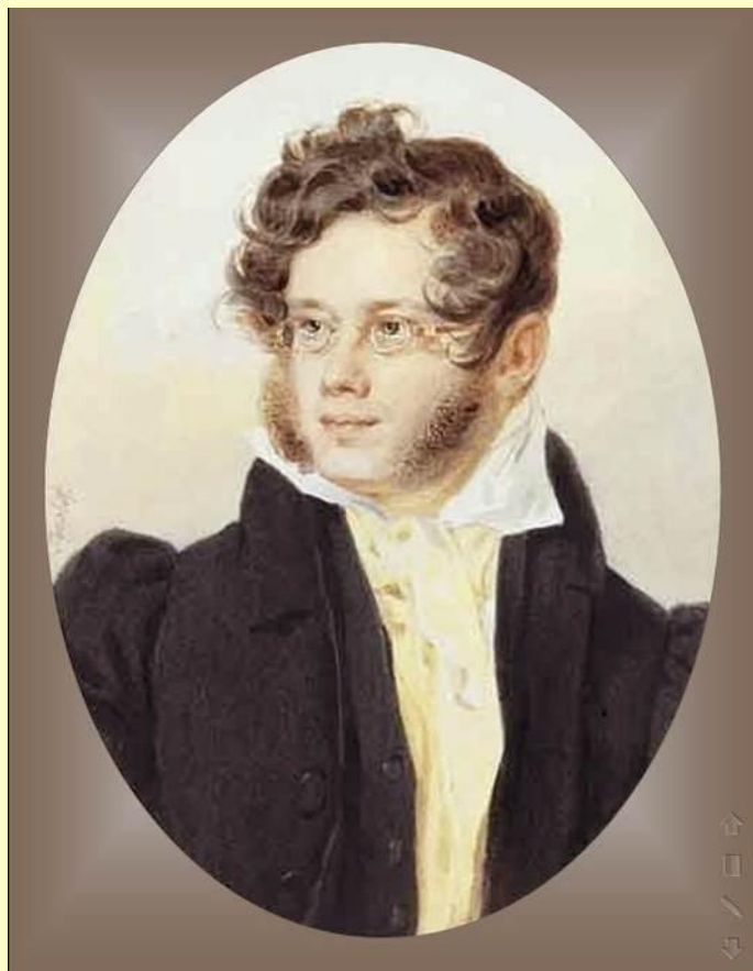
Вяземский Пётр Андреевич