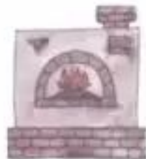
СХЕМА СОСТАВЛЕНИЯ ОПИСАТЕЛЬНОГО РАССКАЗА О ГЖЕЛЬСКОЙ РОСПИСИ