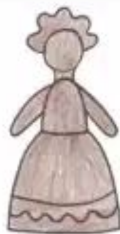
СХЕМА СОСТАВЛЕНИЯ ОПИСАТЕЛЬНОГО РАССКАЗА О ДЫМКОВСКОЙ ИГРУШКЕ