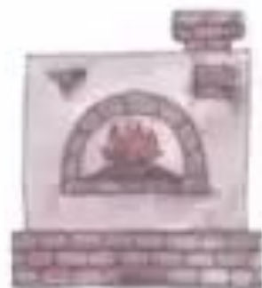
СХЕМА СОСТАВЛЕНИЯ ОПИСАТЕЛЬНОГО РАССКАЗА О ГЖЕЛЬСКОЙ РОСПИСИ