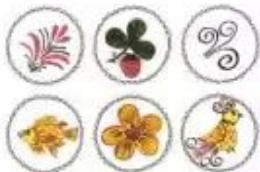
СХЕМА СОСТАВЛЕНИЯ ОПИСАТЕЛЬНОГО РАССКАЗА О ХОХЛОМСКОЙ РОСПИСИ