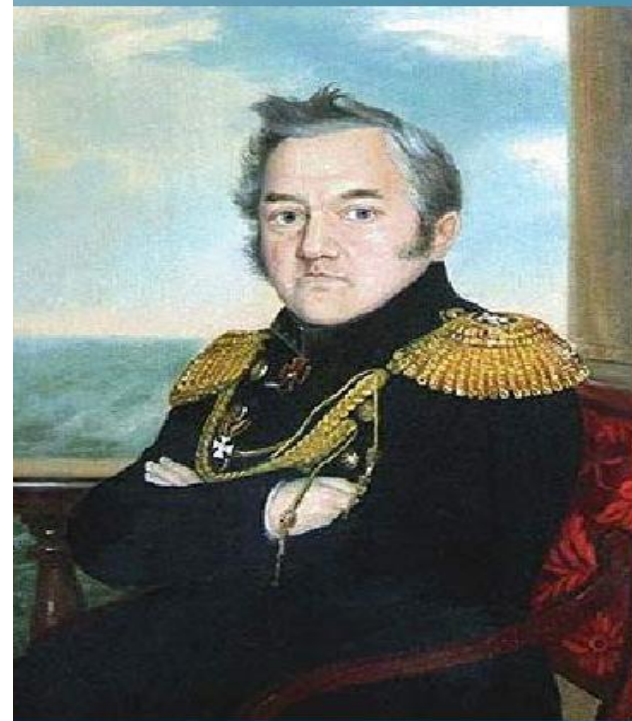
Русские морские офицеры и ученые Фаддей Беллинсгаузен и Михаил Лазарев