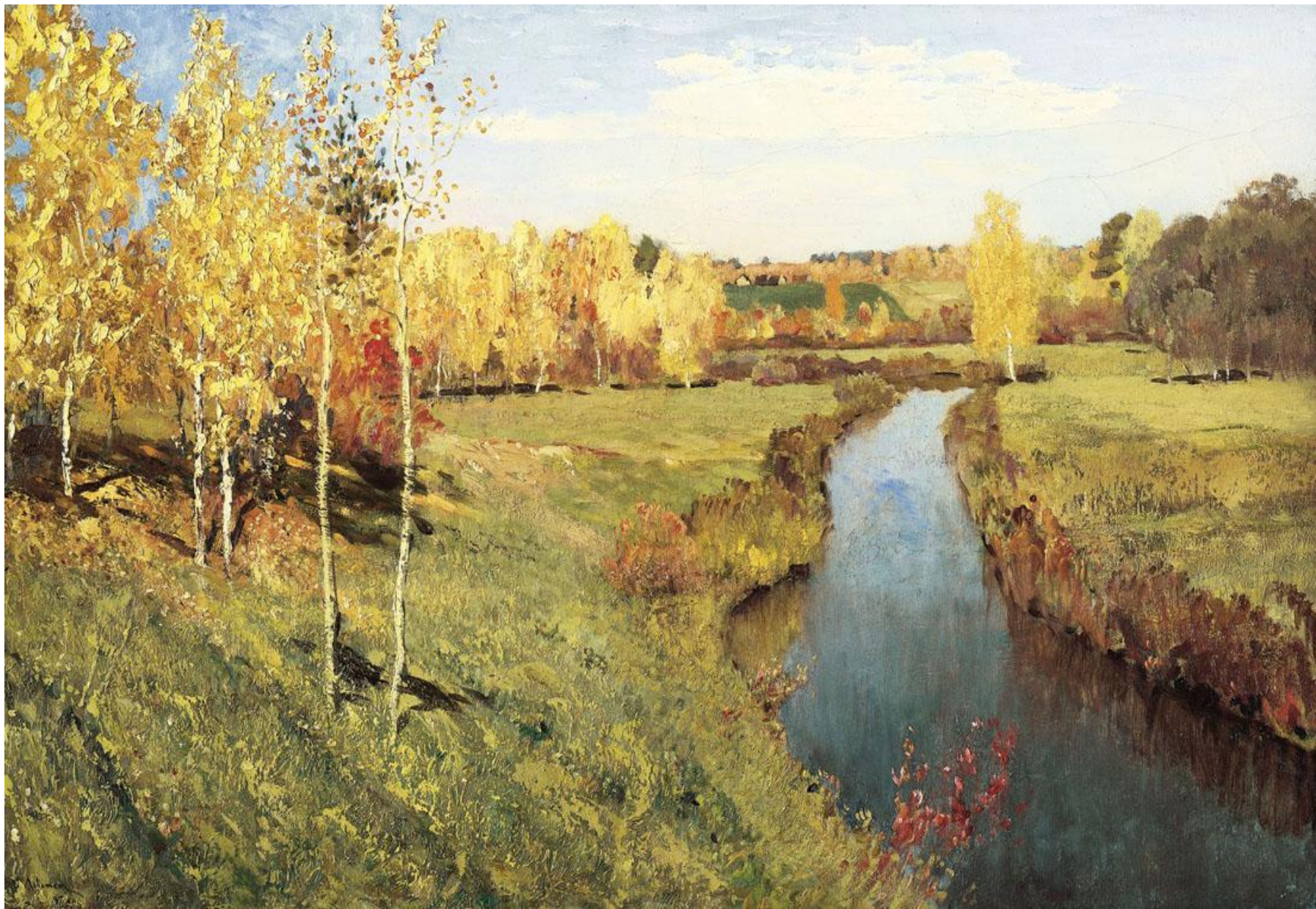
И.И.Левитан. Золотая осень.