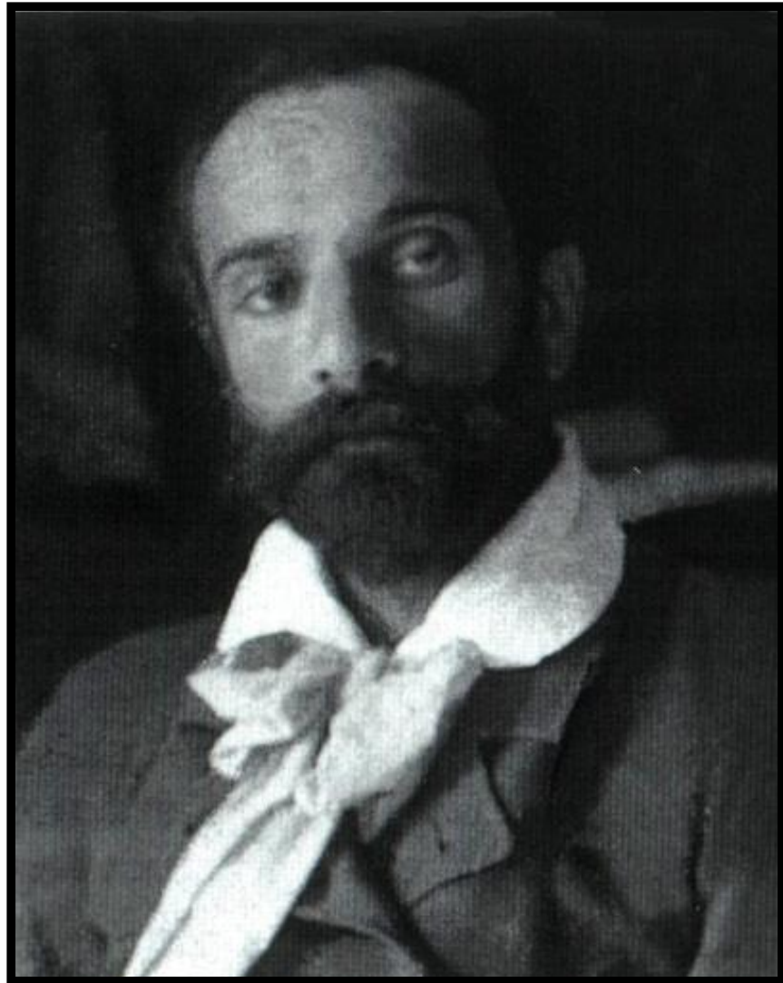
Исаак Ильич Левитан. (1860-1900)