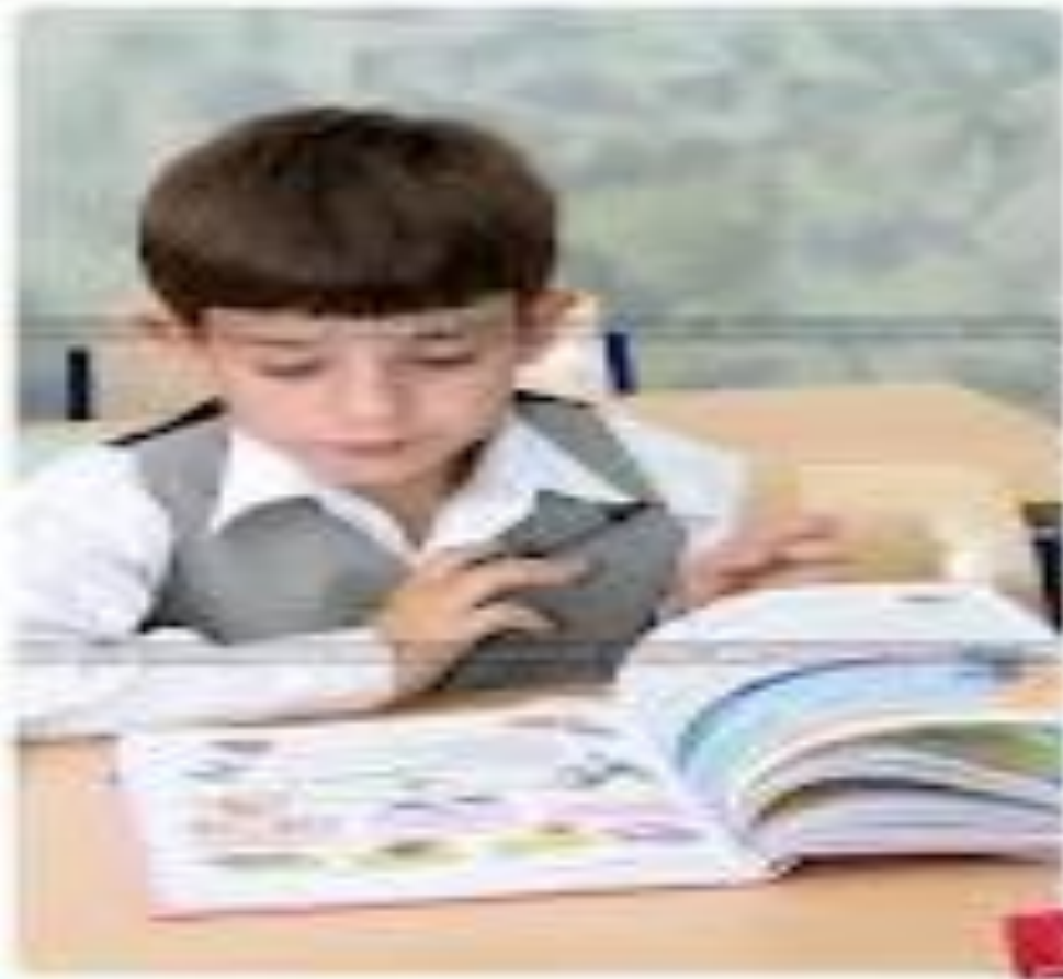
Figure 8.10: A young boy reading a book.