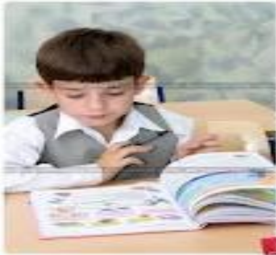
Figure 8.10: A young boy reading a book in a classroom.

© Pearson Education, Inc., 2005. All rights reserved.