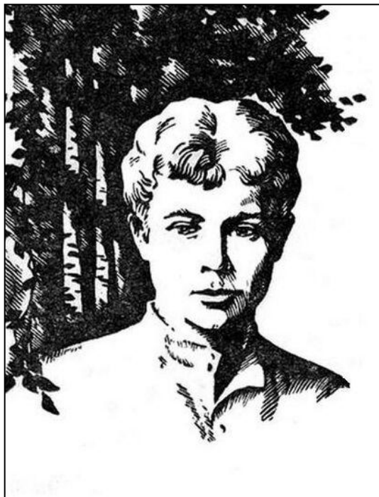
Сергей Александрович ЕСЕНИН – русский поэт (1895-1925)