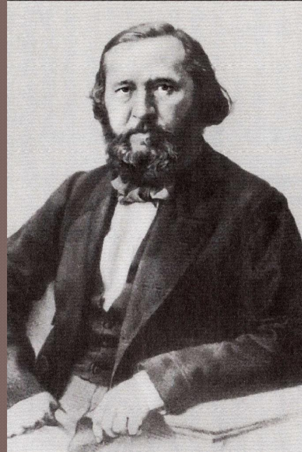
К.С. Аксаков. Литография П.Ф. Бореля