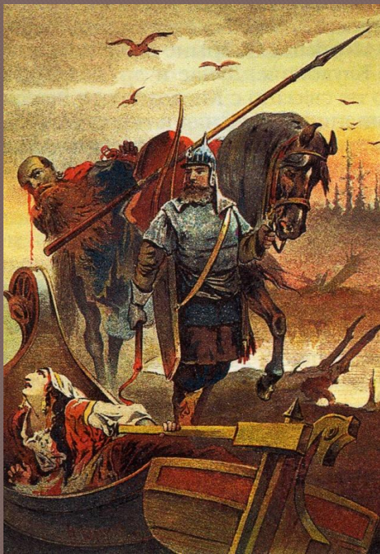
Илья Муромец и Соловей-разбойник