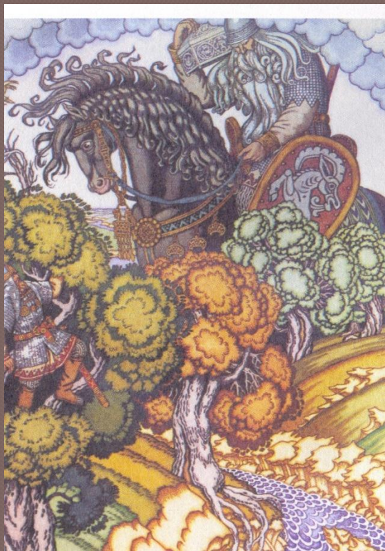
Святогор и Илья Муромец