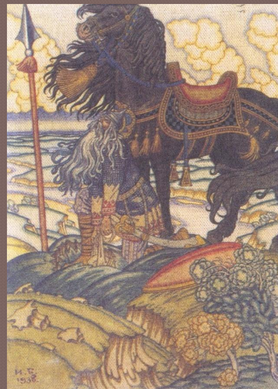
Святогор и перемётная сума