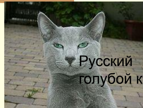
Русский голубой кот