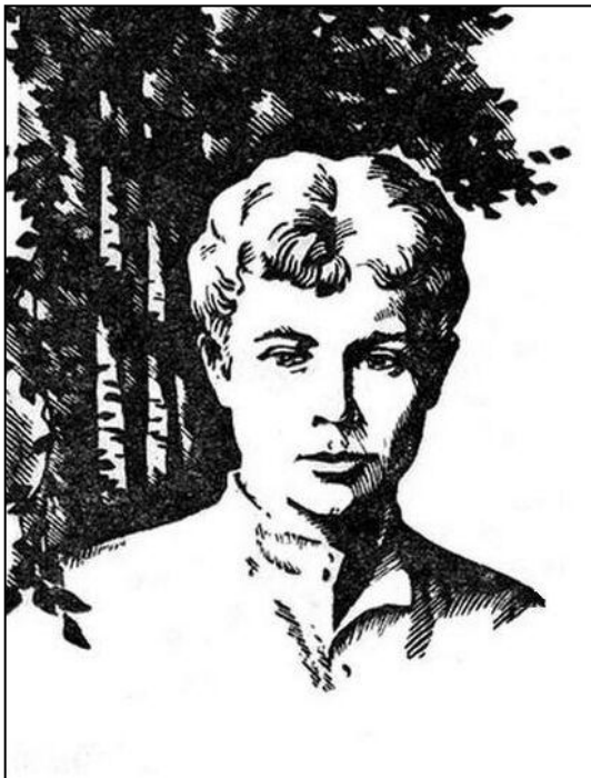
Сергей Александрович ЕСЕНИН – русский поэт (1895-1925)