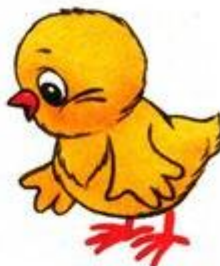
цыплёнок пищит пи-пи-пи