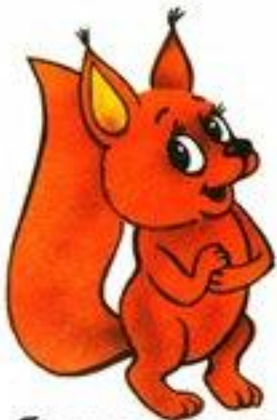
белка цокает цок-цок