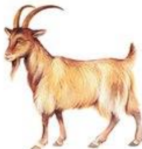
коза мекает ме-ме-ме