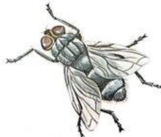
муха жужжит ж-ж-ж-ж