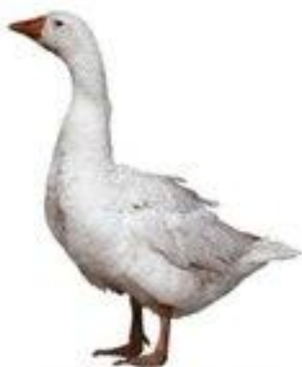
гусь гогочет га-га-га