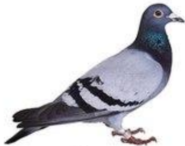
голубь воркует гуль-гуль