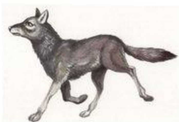
волк воет у-у-у-у-у