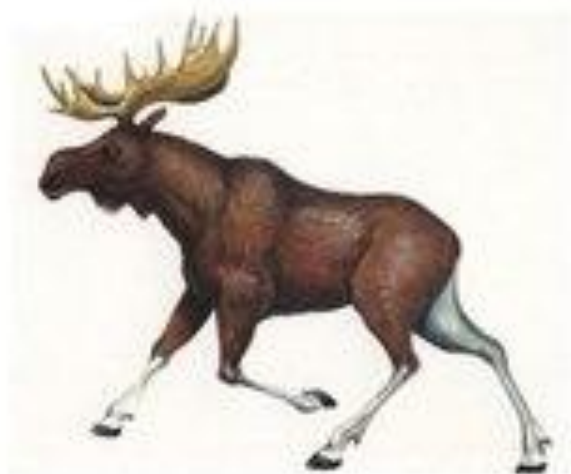
лось трубит у-у-у-у-у