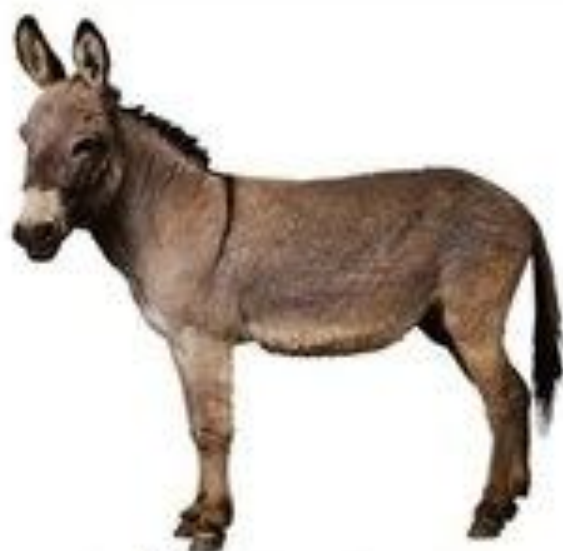
осёл говорит иа-иа-иа