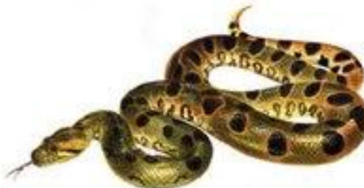
змея шипит ш-ш-ш