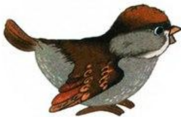
воробей чирикает чир-чир