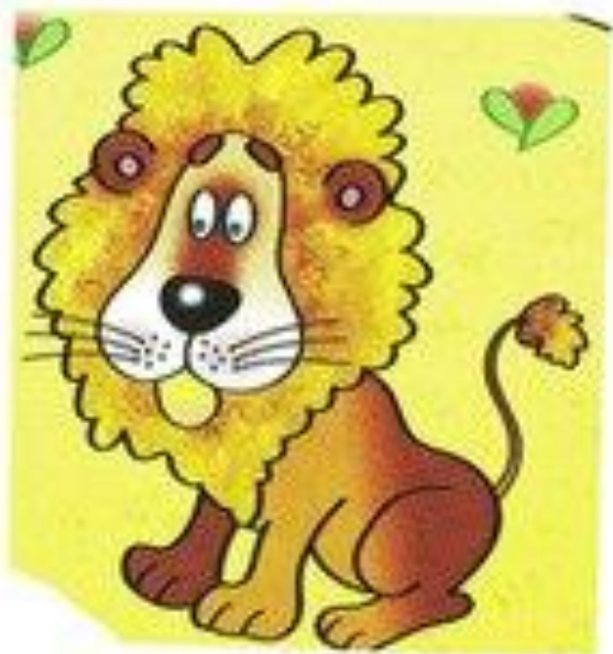
лев рычит р-р-р