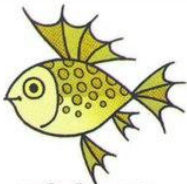
рыба булькает буль-буль