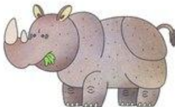
носорог фыркает фыр-фыр