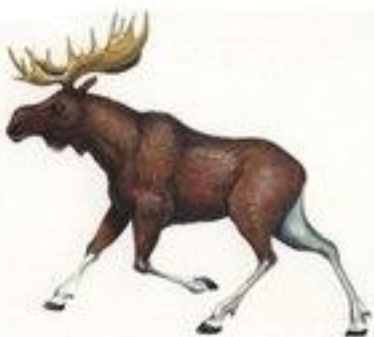
лось трубит у-у-у-у-у