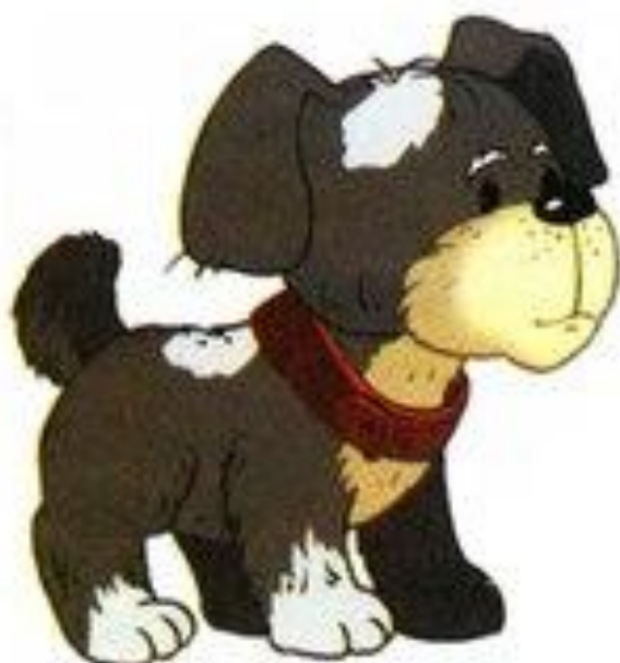
собака гавкает гав-гав