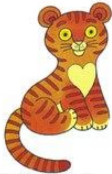
тигр рычит р-р-р-р-р