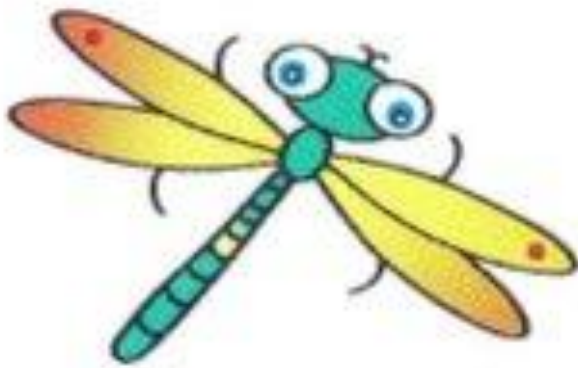
стрекоза стрекочет тр-тр-тр