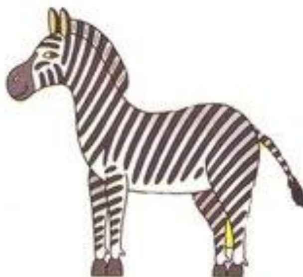
зебра ржёт иго-го