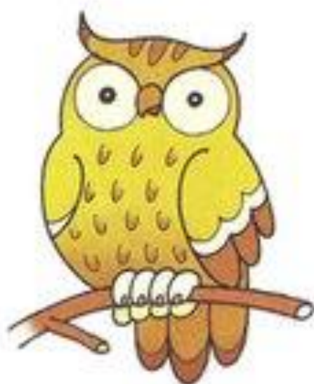
сова ухаёт ух-ух