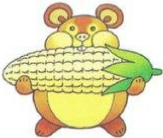
хомяк хрумтит хрум-хрум