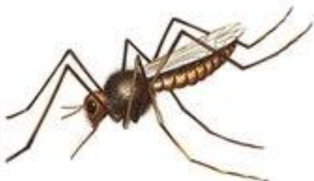
комар пищит пи-пи-пи