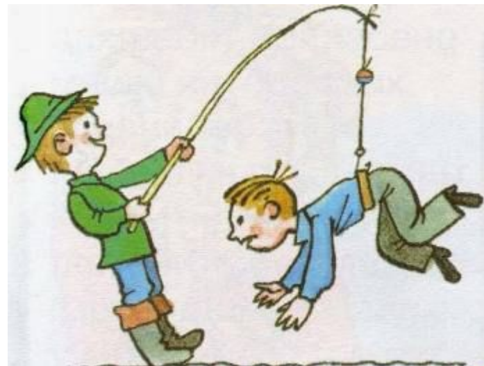
Поймать на удочку