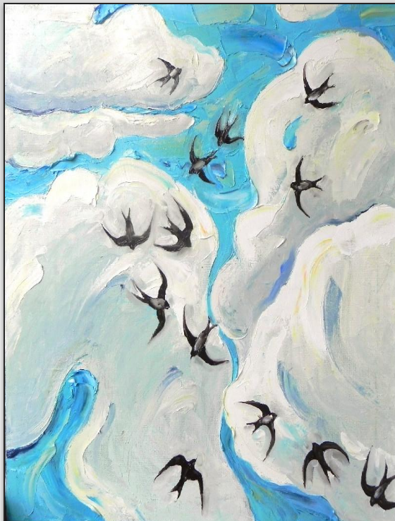
Велиляев Ленур «Ласточки»