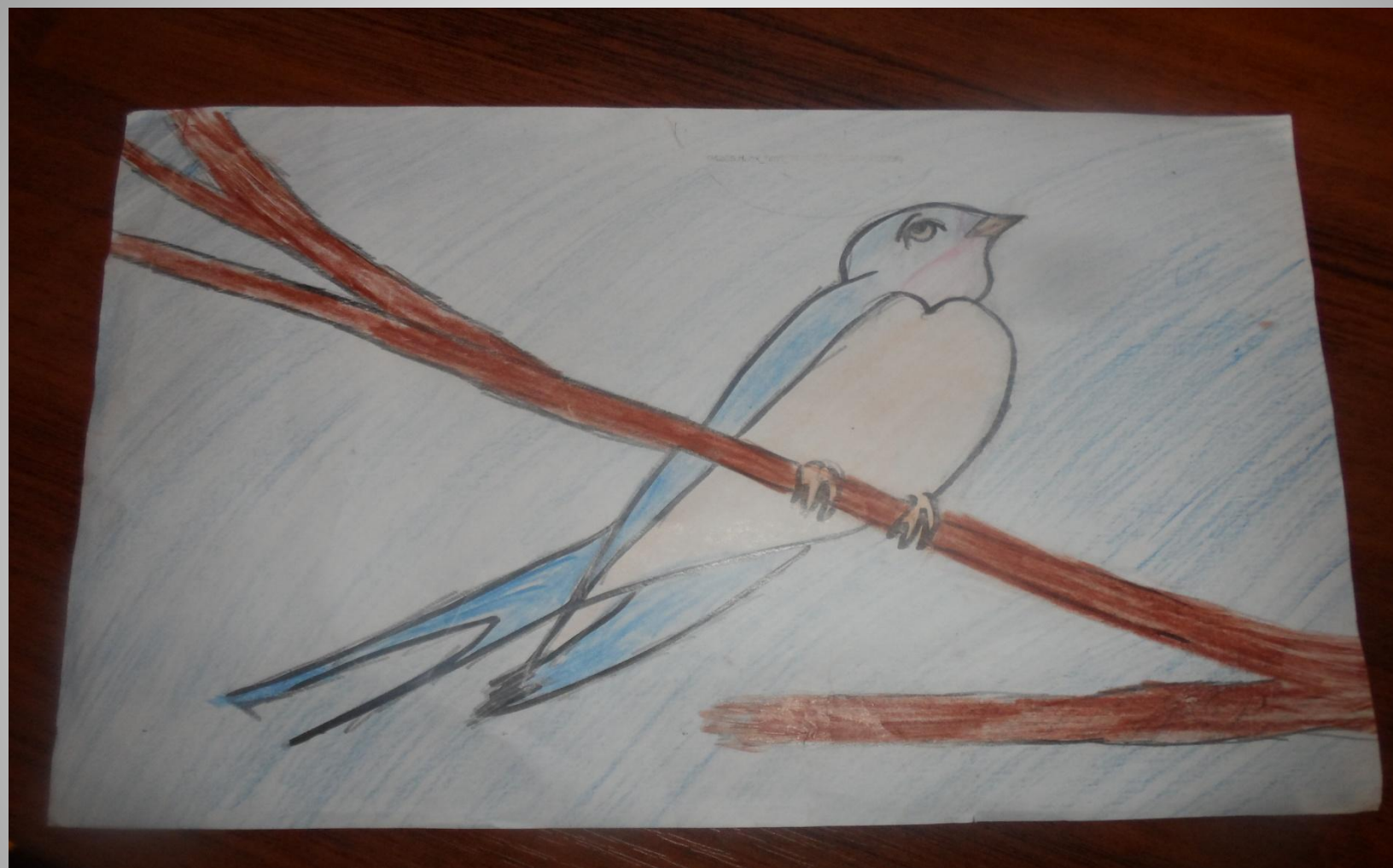
Мой рисунок ласточки