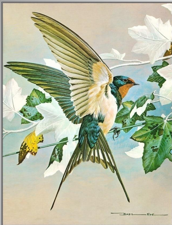
Василий Эде «Ласточка деревенская»