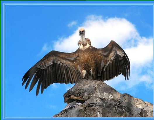
Гол как сокол

Например: мастер на все руки, не робкого десятка, цены нет, гол как сокол, легок на подъем, не от мира сего.