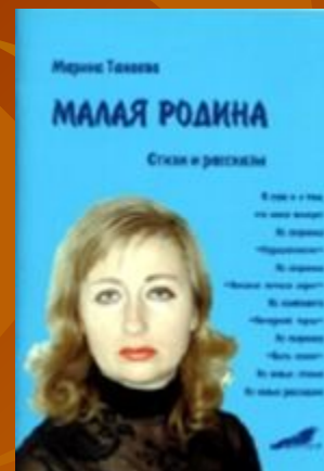
Малая родина. 2007