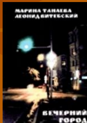
Вечерний город. 2005