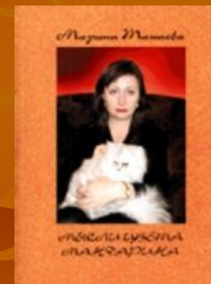
Мысли цвета мандарина. 2008