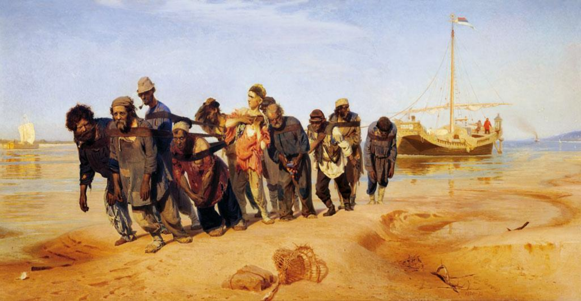
И.Е.Репин «Бурлаки на Волге»