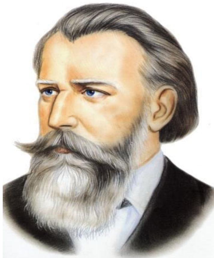
Брамс Иоганнес (1833–1897)