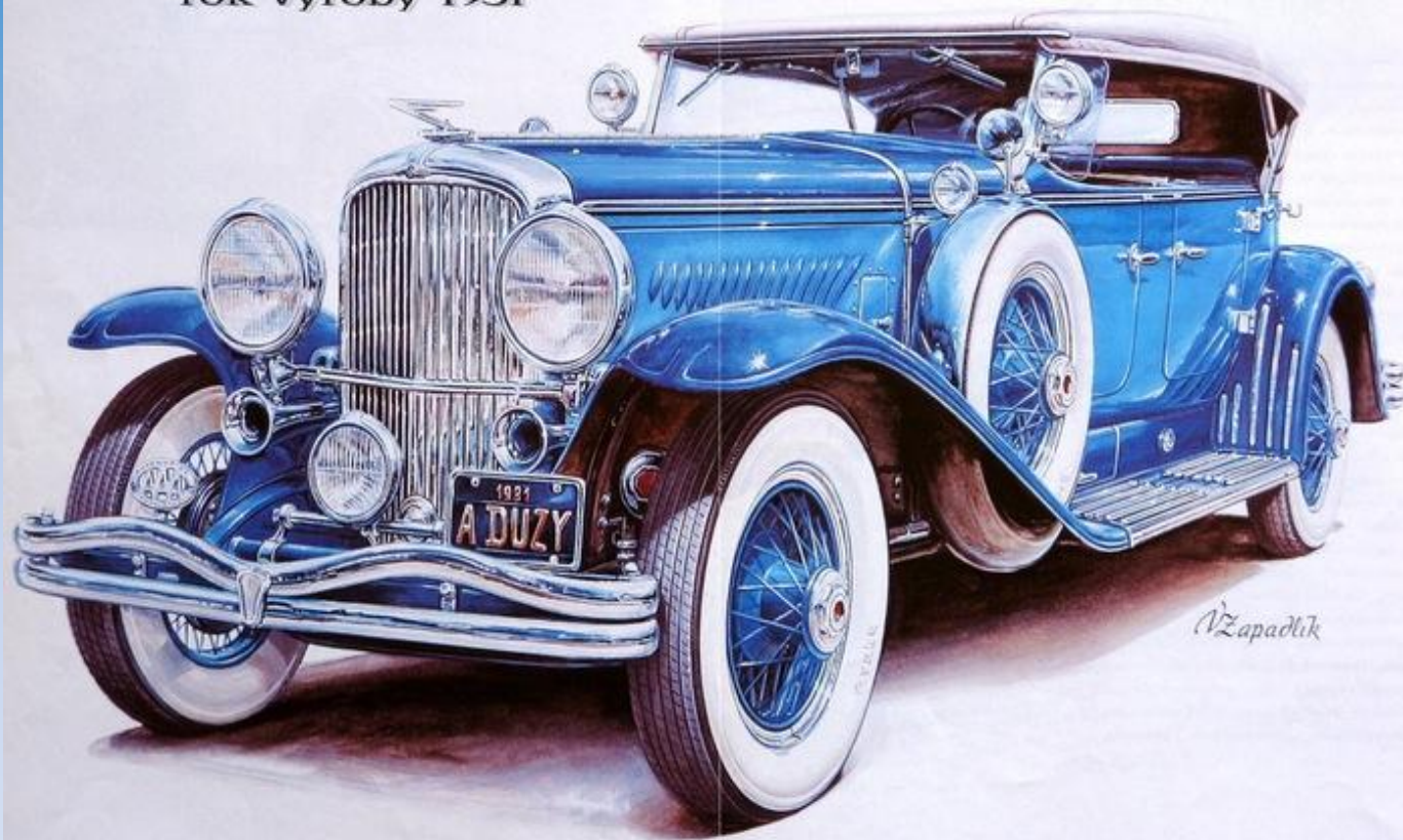
DUESENBERG, MODEL J rok výroby 1931