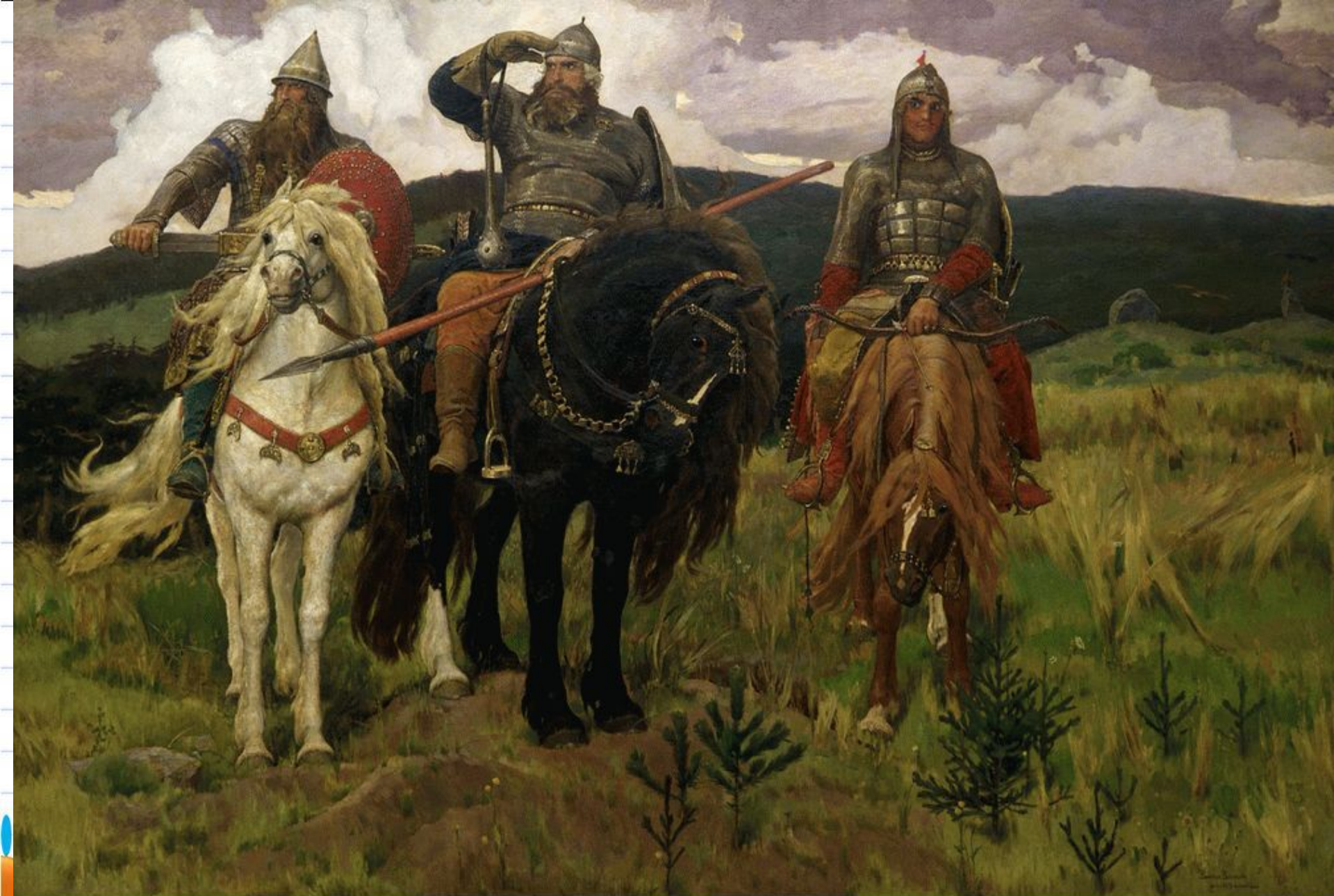
В.М.Васнецов. "Богатыри". 1881-1898 гг. Гос. Третьяковская галерея