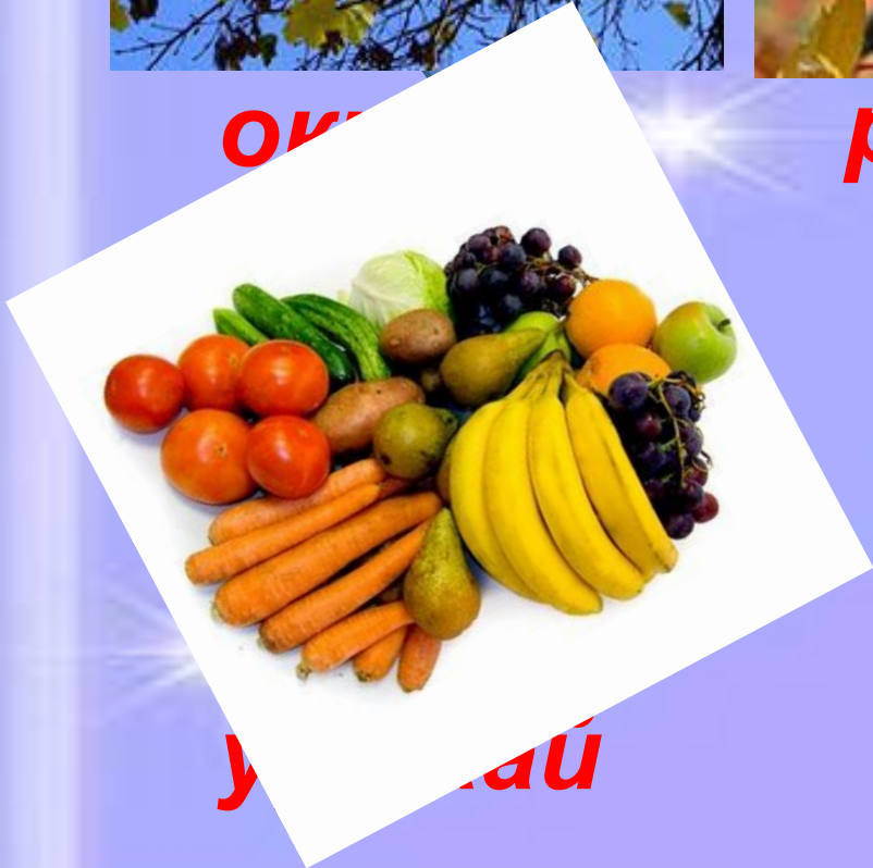
овощи и фрукты