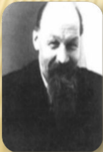
Реформатский Александр Александрович – русский языковед (1900-1978гг.)

...Местоимения выделяются в особый класс слов – заменителей, которые, как «запасные игроки» на футбольном поле или «дублёры» в театре, выходят на поле, когда вынужденно «освобождают игру» знаменательные слова.