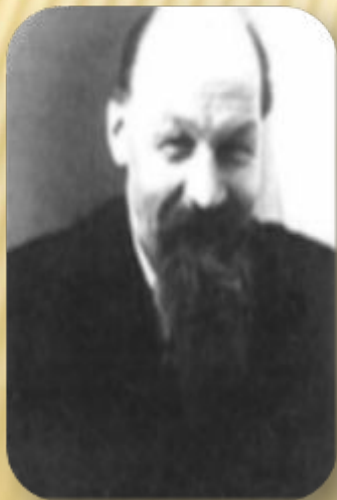
Реформатский Александр Александрович – русский языковед (1900-1978гг.)

...Местоимения выделяются в особый класс слов – заменителей, которые, как «запасные игроки» на футбольном поле или «дублёры» в театре, выходят на поле, когда вынужденно «освобождают игру» знаменательные слова.