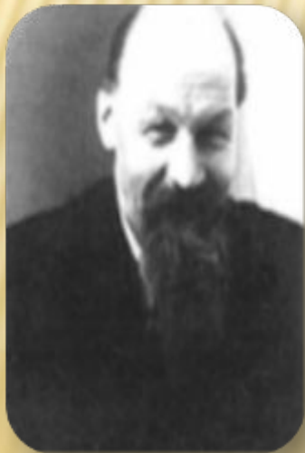
Реформатский Александр Александрович – русский языковед (1900-1978гг.)

...Местоимения выделяются в особый класс слов – заменителей, которые, как «запасные игроки» на футбольном поле или «дублёры» в театре, выходят на поле, когда вынужденно «освобождают игру» знаменательные слова.