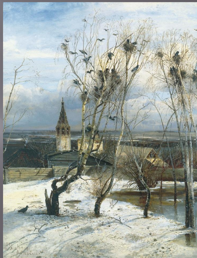
Картина А.Саврасова «Грачи прилетели»