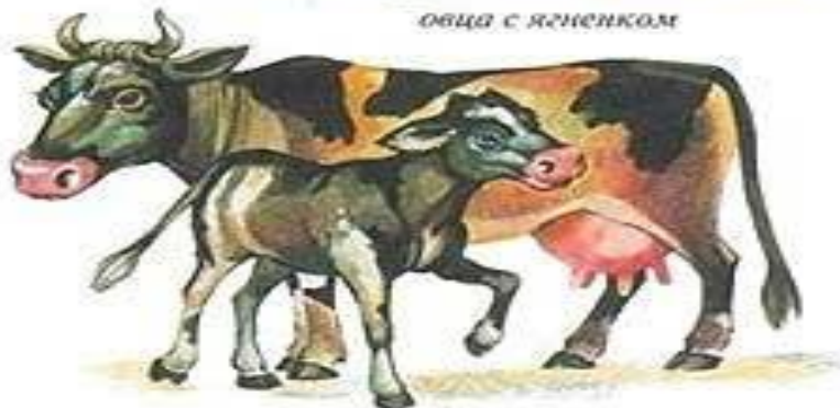
КОРОВА С ТЕЛЕНКОМ