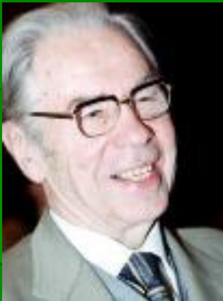
Ф.Л. РЕШЕТНИКОВ 1906-1988