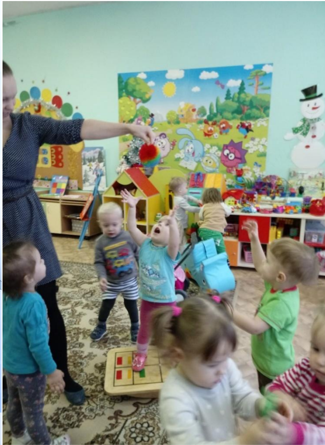
Игра «Буль – Цап»

Речевые игры основаны на взаимосвязи речи и движения. Игры проходят очень эмоционально, способствуют стабилизации работы вестибулярной системы и совершенствованию зрительно-моторной координации, развитию речи и словарного запаса.