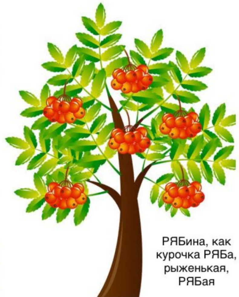
РЯБина, как курочка РЯБа, рыженькая, РЯБая