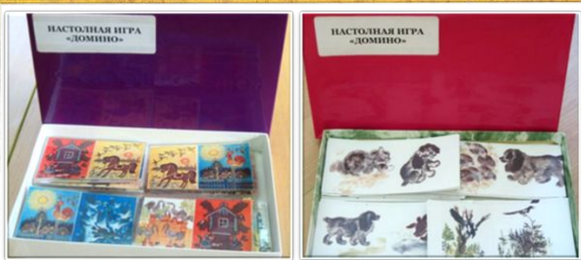
Настольно – печатная дидактическая игра «Домино»