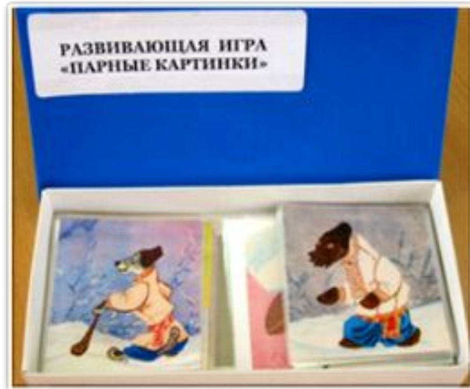
Настольно – печатные дидактические игры «Разрезные картинки», «Парные картинки»