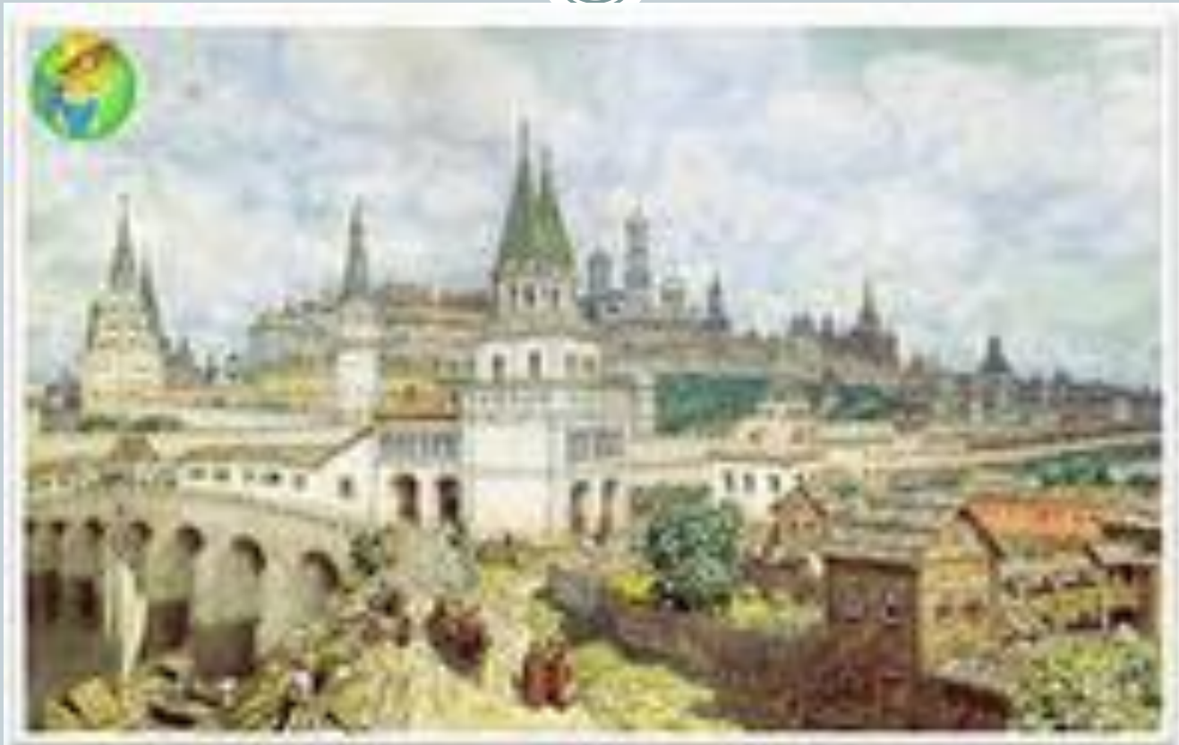
«Москва белокаменная» А.М. Васнецов