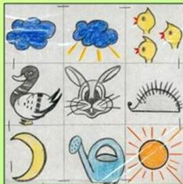
Сказка «У солнышка в гостях»