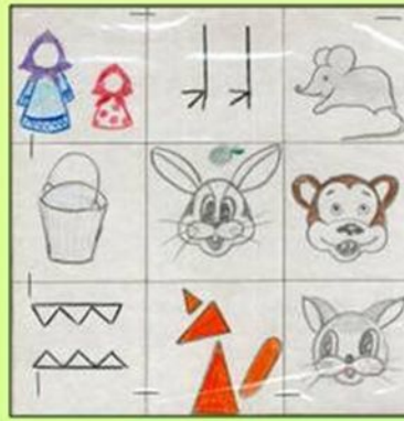
Сказка «У страха глаза велики»