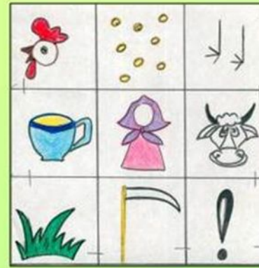
Сказка «Петушок и бобовое зернышко»