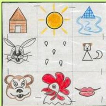
Сказка «Заюшкина избушка»