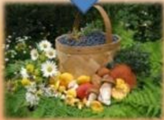
ягоды, грибы, цветы