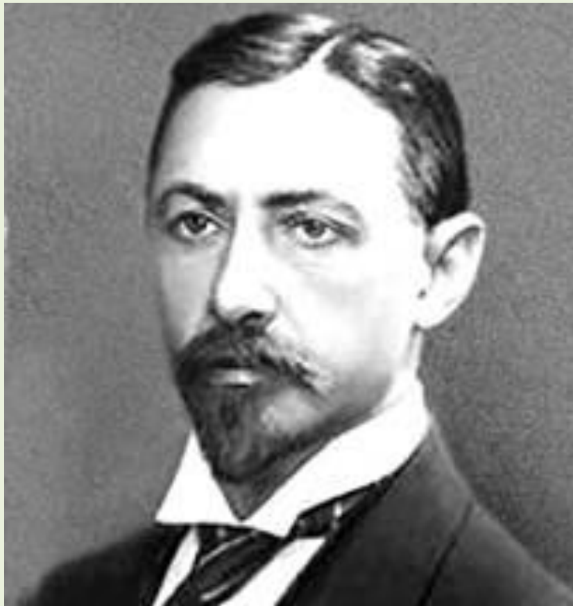
Бунин Иван Андреевич