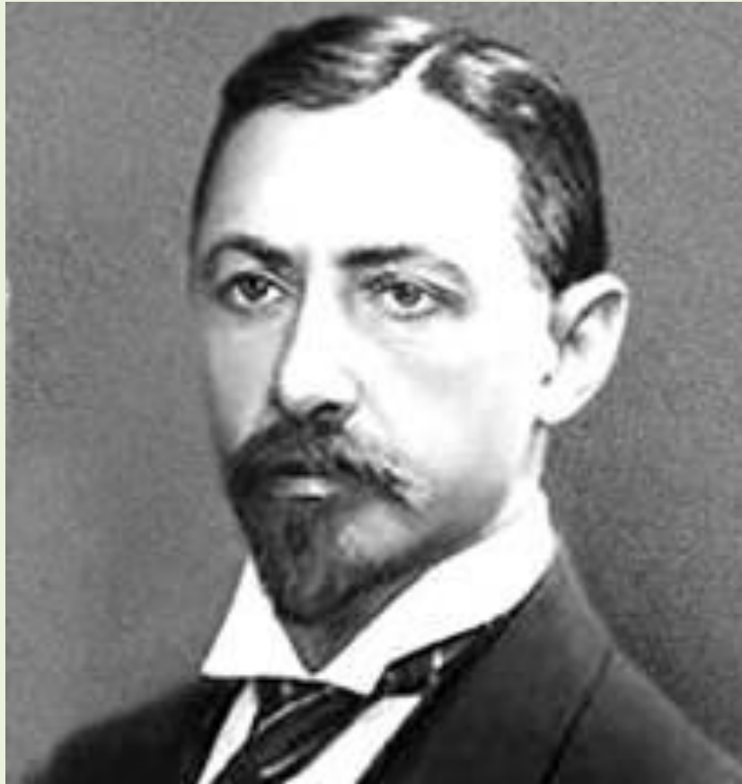
Бунин Иван Андреевич