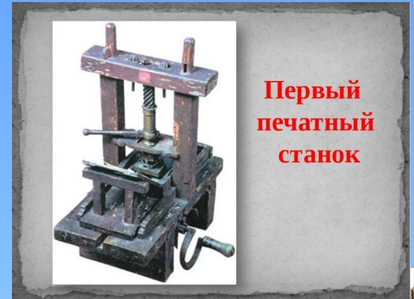
Первый печатный станок