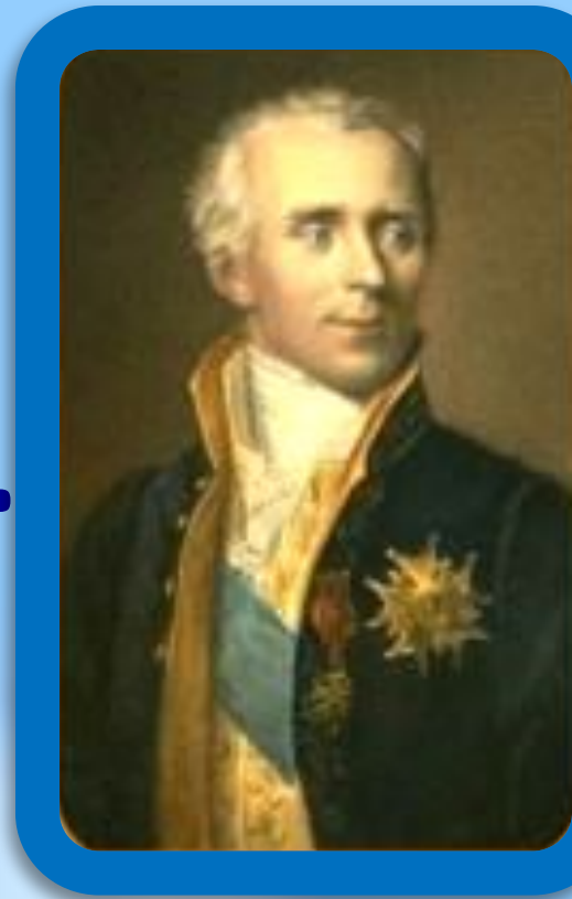
Пьер Симон Лаплас (XVIII - XIX в.) математик, астроном

То, что мы знаем, – ограничено, а то, чего мы не знаем, – бесконечно.