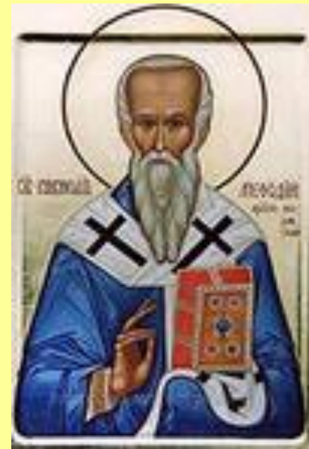
Святой равноапостольный Кирилл