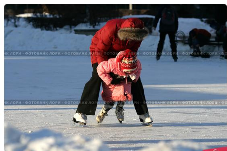
Катание на коньках