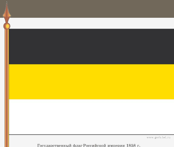
Государственный флаг Российской империи 1858 г.