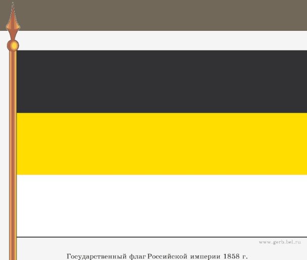
Государственный флаг Российской империи 1858 г.