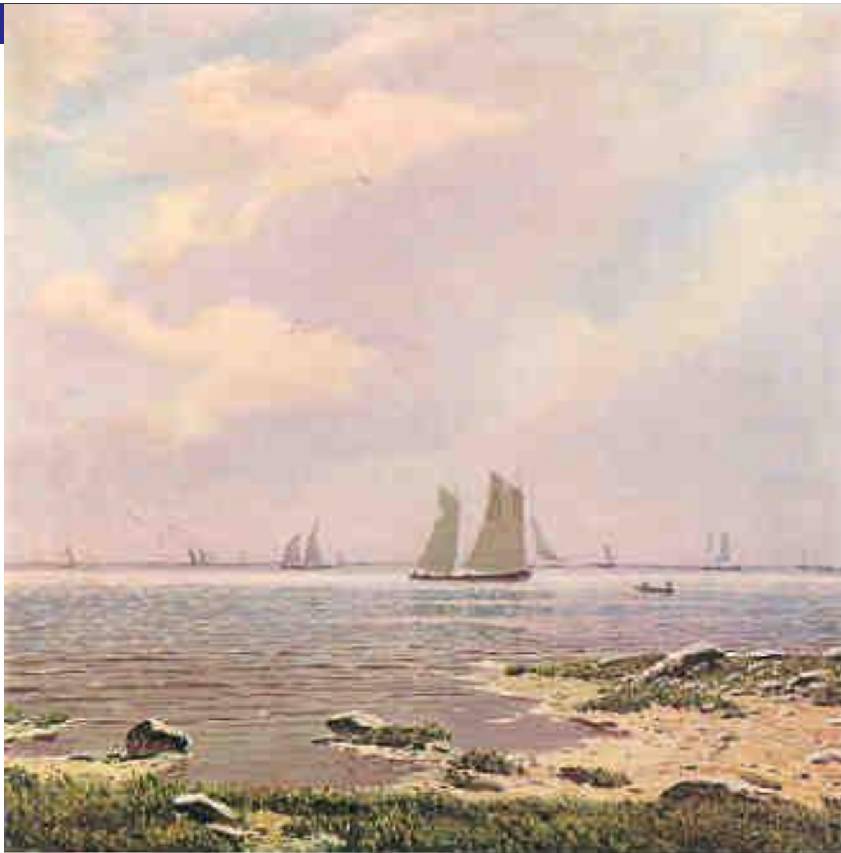
Н.Н. Дубовский. Море.