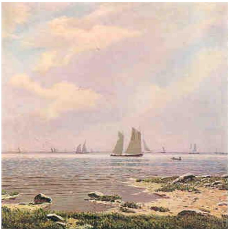
Н.Н. Дубовский. Море.