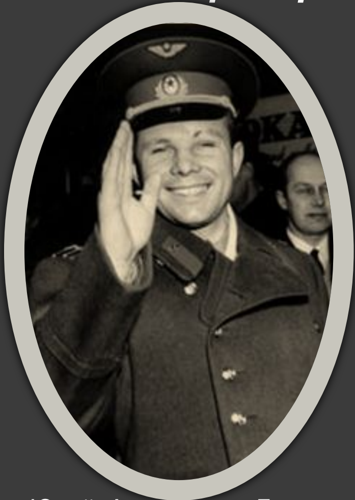
Юрий Алексеевич Гагарин