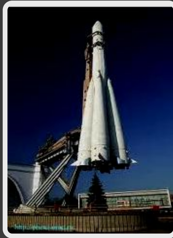
Первый полёт в космос