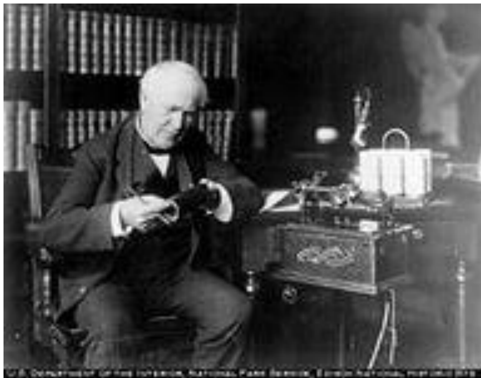
Томас Элва Эдисон