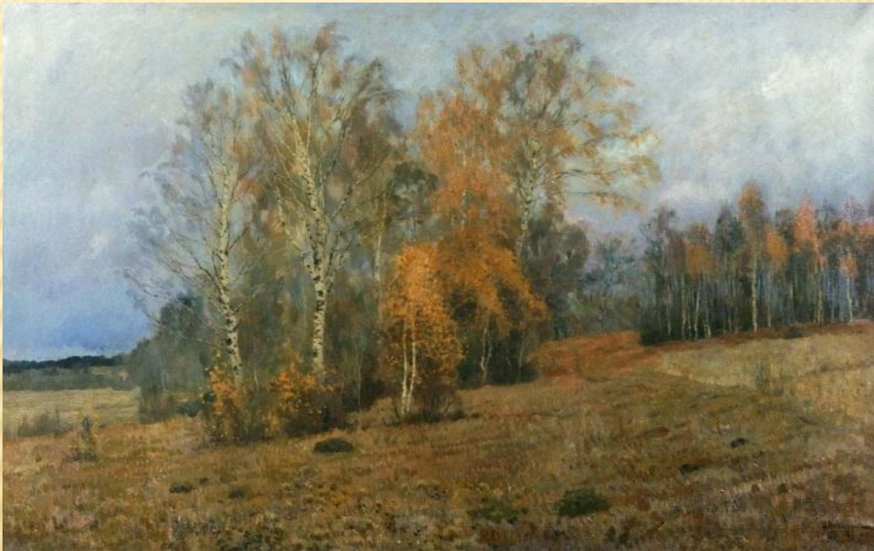
Октябрь. Осень. Исаак Левитан