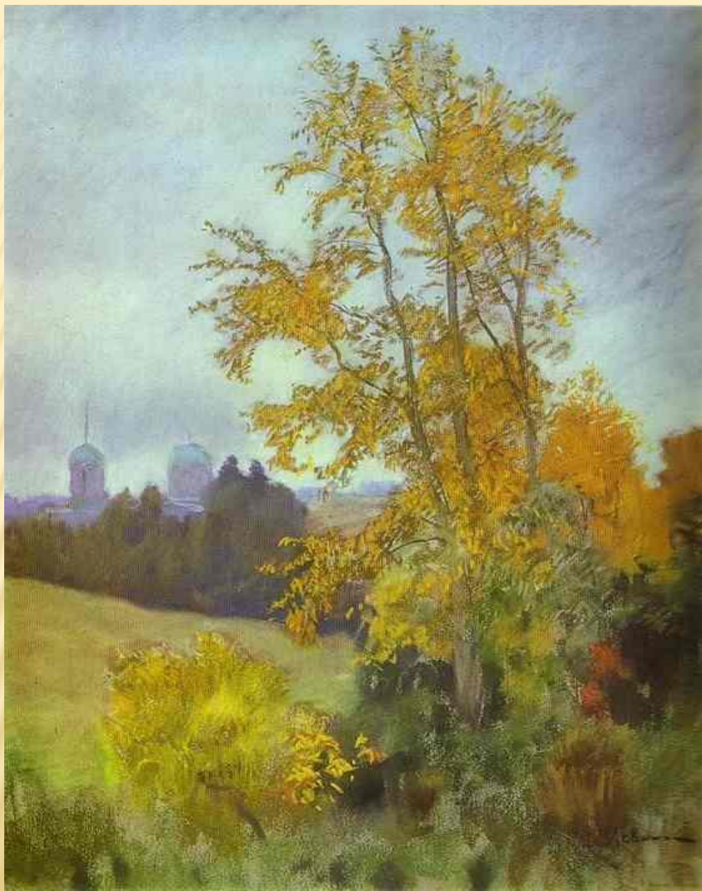
Осенний пейзаж с церковью. Исаак Левитан