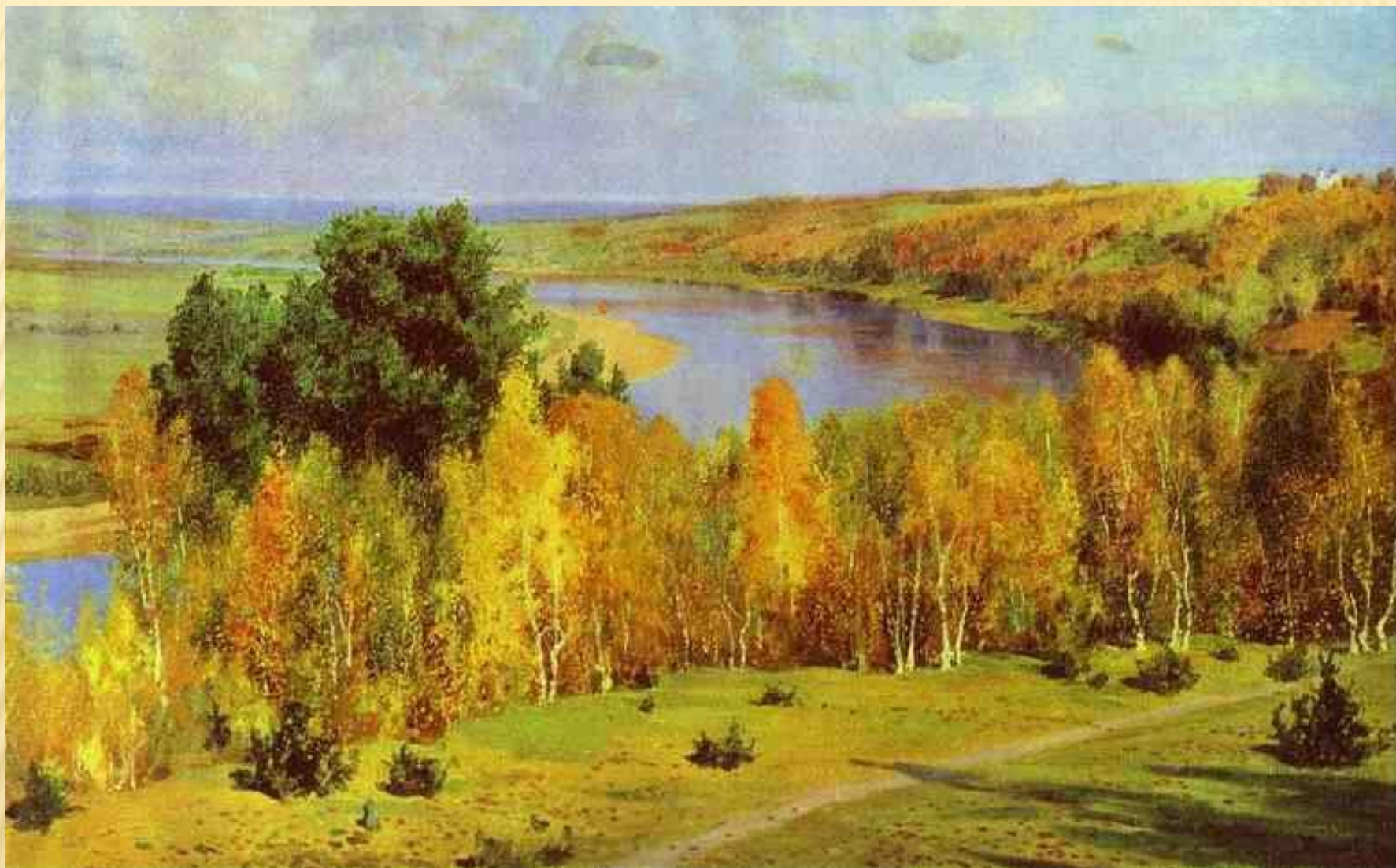
Золотая осень. Василий Polenov