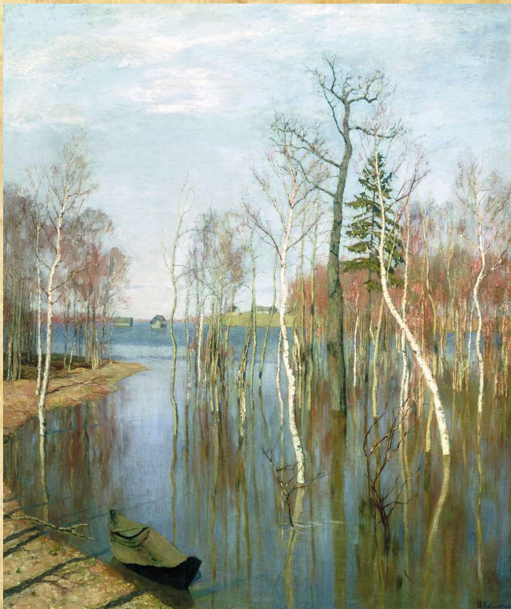
И. Левитан «Весна — большая вода» 1896-1897